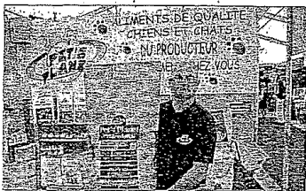
Séphanie Sanderson anime le stand Pet's Planet

Nous livrons de la nourriture pour animaux à domicile